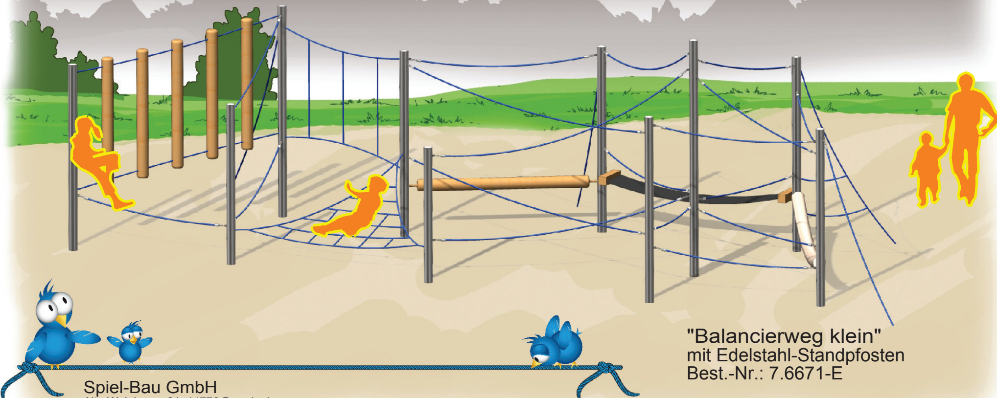
"Balancierweg klein" mit Edelstahl-Standpfosten Best.-Nr.: 7.6671-E